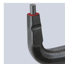
Fastsättning genom pressning

Invändigt liggande fjäder: skyddat läge i skruvad precisionsled. Inget hinder vid arbetet, ingen smuts eller förlust