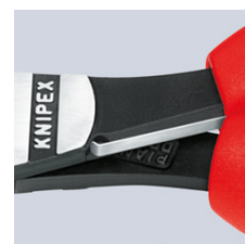
74 12: Öppningsfjäder i deaktiverad position