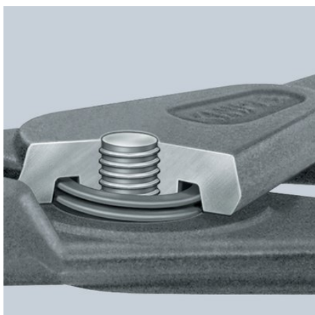
Invändigt liggande fjäder: skyddat läge i skruvad precisionsled. Inget hinder vid arbetet, ingen smuts eller förlust