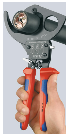
Spärrmekanism och tvåväxlad kugghjulsdrift för kraftsparande klippning