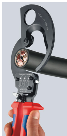
95 31 280: Hög kapacitet: max Ø 52 mm / 380 mm 2